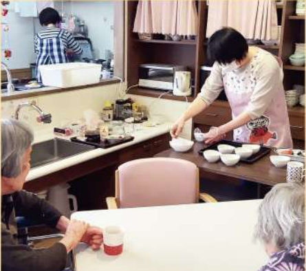
◀◀おひとりおひとりに配慮した食事の準備