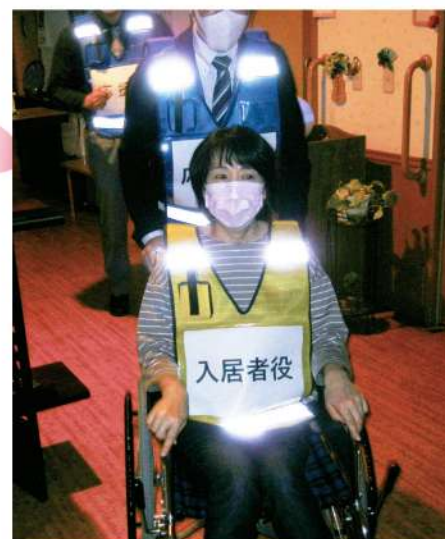
▲職員も入居者役で避難しました