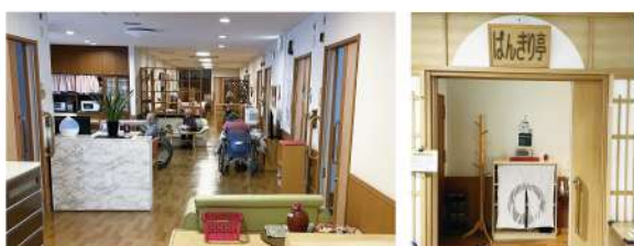
▲談話コーナーから居間に向けて ▲玄関はこちら

こんにちは! 3階のばんきり亭です。 ばんきり亭では、一人ひとりがそれぞれのリズムで過ごして