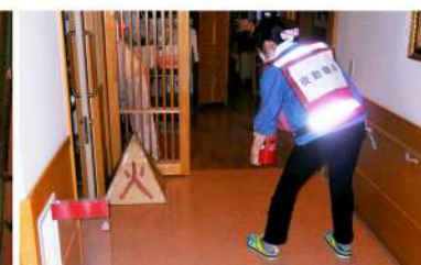
▲初期消火失敗しました!