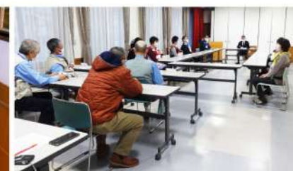
▲避難訓練終了後の振替りの様子です

深夜0時に1階介護事務室から火災が発生した想定で訓練を行いました。深夜の火災では、消火や通報、入居者の避難誘導を数名の職員だけで行わなければならないため、緊張感のある訓練でした。訓練終了後には、消防計画(マニュアル)の見直しに向けて、振り返りをおこないました。