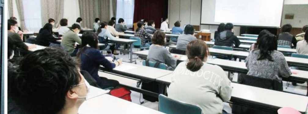
▲みなさん熱心に受講しました