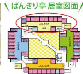
▶ばんきり亭 居室図面