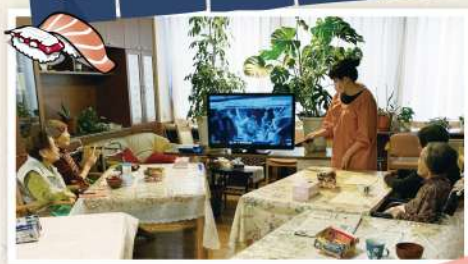
▲入居者様のリクエストで、映画「ものくろ王将」を観ながら食べました