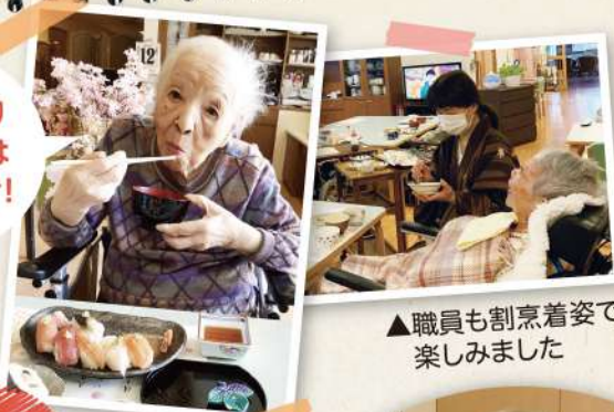
▲職員も割烹着姿で楽しみました