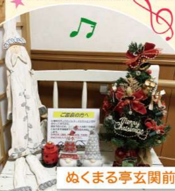
めくまる亭玄関前